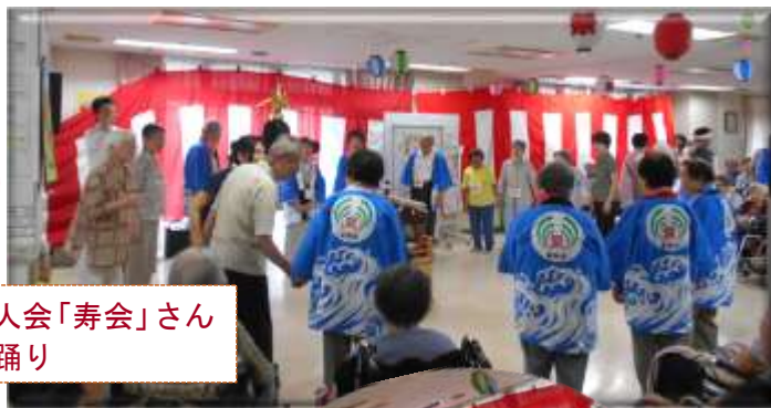
地元の老人会「寿会」さんによる盆踊り